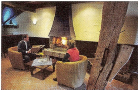
Met de romantiek van het boerenleven

doen al dertig jaar varkens, dat moeten we blijven doen, daar zijn we goed in.'